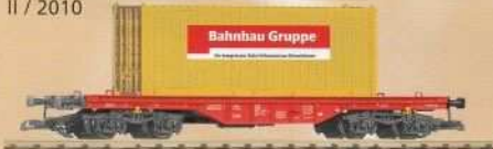
37706 Flachwagen mit 20' Baucontainer DB AG Ep. V Flat Car w/ 20' container DB AG V