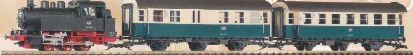
37110 Personenzug BR 80 mit 2 Umbauwagen / BR 80 with 2 Passenger Cars