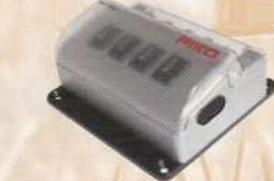
35260 Stellpult Switch Control Box