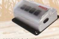
35261 Schaltpult Switch Control Box on/off