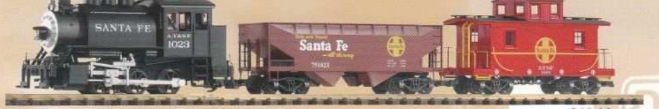
37104 Santa Fe Güterzug / Santa Fe Freight Train