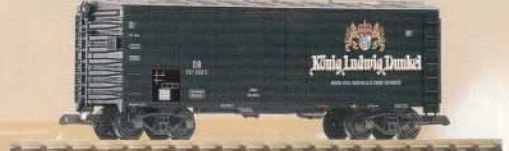
37804 Bierwagen „König Ludwig Dunkel“ DB Ep. III Refrigerator Car "König Ludwig Dunkel" DB III