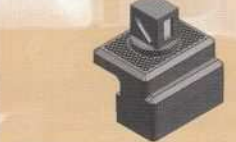
35266 Weichenlaternen, beleuchtet Switch lantern, lighted 9,00 €*