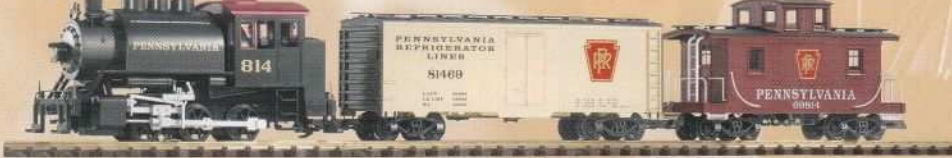
37103 Pennsylvania Railroad Güterzug / Pennsylvania Railroad Freight Train