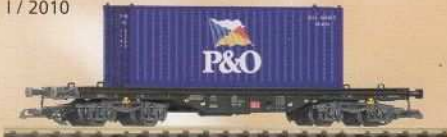
37705 Flachwagen mit 20' Container „P&O“ DB AG Ep. V Flat Car w/ 20' container "P&O" DB AG V