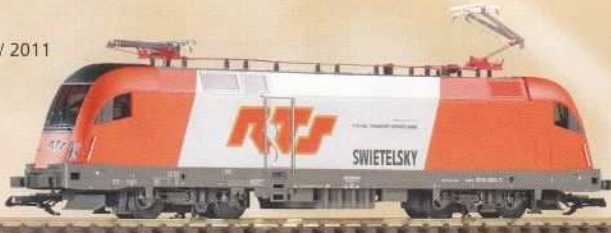
37420 E-Lok Taurus „RTS“ Ep. VI 270,50 €* Taurus Electric Loco „RTS“ VI