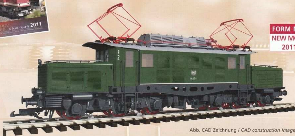
Abb. CAD Zeichnung / CAD construction image