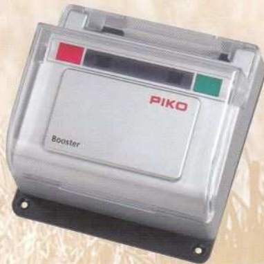
35015 Digitalbooster 189,99 €* Wenn die Leistung der Digitalzentrale bei Ihrer Anlage nicht mehr ausreichend ist, benötigen Sie einen oder mehrere Booster. Diese übertragen die Fahr- und Schaltbefehle der Zentrale in elektrisch getrennte Gleisabschnitte mit eigener Stromversorgung. Eingang: 16-22 V DC/AC, max. 5 A Ausgang: ca. 20 V DCC geregelt, max. 5 A