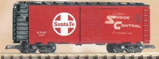
38811 Santa Fe Güterwagen 52,99 €* Santa Fe Box Car Vorserienmuster / pre-production sample