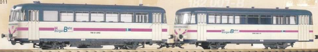
37303 Schienenbus VT798 / VS998 „Elbe-Elster“ Ep. VI VT798 / VS998 Railbus and Trailer, „Elbe-Elster“ VI