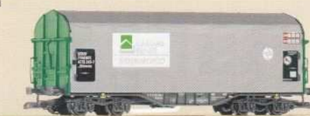
37710 Schiebeplanenwagen Shimms 723 RENFE Ep. VI 100 486 VI REN FE 84,99 €* Sliding Tarp Car Shimms 723 RENFE VI