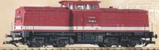
37561 Diesellokomotive BR 110 DR Ep. IV 270,50 €* Diesel Locomotive BR 110 DR IV