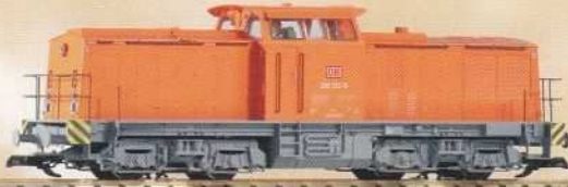
37562 Diesellokomotive BR 298 DB AG Ep. V 270,50 €* Diesel Locomotive BR 298 DB AG V