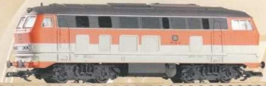
37506 Diesellokomotive BR 218 „City Bahn“ DB Ep. IV 270,50 €* BR 218 Diesel Locomotive „City Bahn“ DB IV