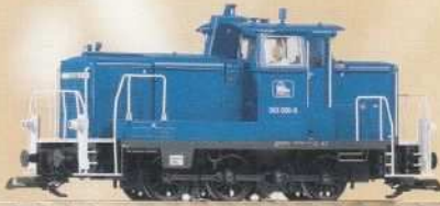
37522 Diesellokomotive BR 260 „Preßnitztal“ Ep. V 270,50 €* Diesel Locomotive BR 260 „Preßnitztal“ V