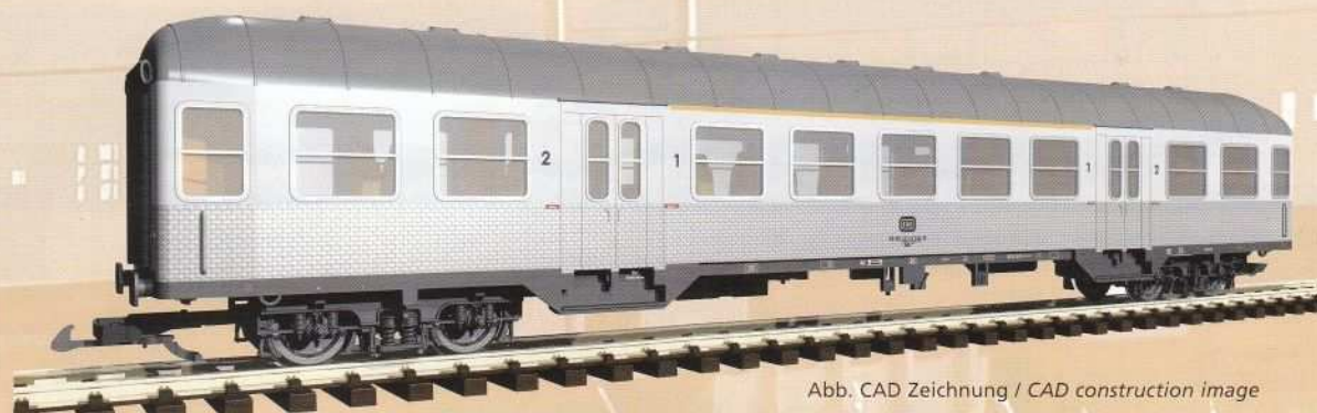
Abb. CAD Zeichnung / CAD construction image