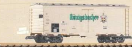
37806 Bierwagen „Königsbacher“ DB Ep. III 100 362 III DB 52,99 €* Refrigerator Car "Königsbacher" DB III