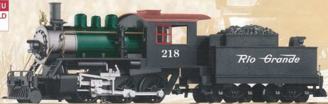
38210 Dampflokomotive mit Tender „Mogul“ D&RGW Steam loco „Mogul“ with tender D&RGW