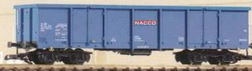
37737 Offener Drehgestellwagen Eaos „Nacco“ ČD Ep. VI 100 580 VI ČD 84,99 €* High-Side Gondola Car Eaos „Nacco“ ČD VI