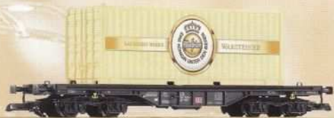
37711 Flachwagen mit 20' Container „Warsteiner“ DB AG Ep. VI 100 486 VI DB AG 99,99 €* Flat Car w 20' container "Warsteiner" DB AG VI