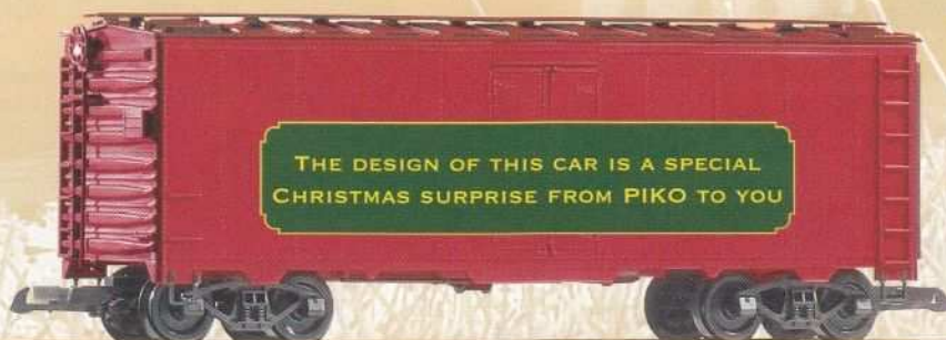
38815 Weihnachtswagen - Lassen Sie sich vom Design des Wagens überraschen! 100 362 52,99 €* Christmas Steel Reefer Car