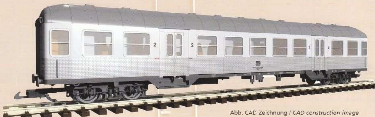
Abb. CAD Zeichnung / CAD construction image

0-24 V --- 500 730 1000 1500 2000 2500 3000 3500 4000 4500 5000 5500 6000 6500 7000 7500 8000 8500 9000 9500 10000