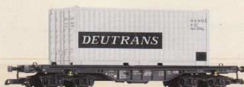
37713 Flachwagen mit 20' Container „Deutrans“ DR Ep. IV 100 486 IV DR 99,99 €* Flat Car with 20' Container "Deutrans" DR IV