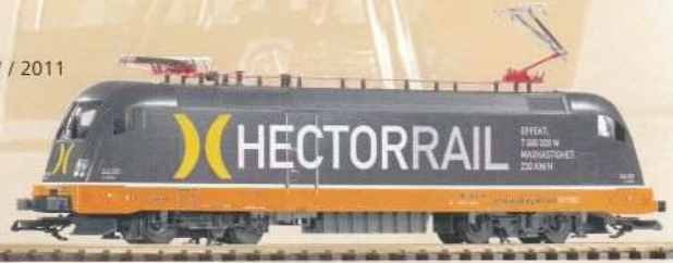
37421 E-Lok Taurus „Hectorrail“ Ep. VI 270,50 €* Taurus Electric Loco „Hectorrail“ VI