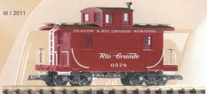
38814 Caboose D&RGW 52,99 €* D&RGW Caboose Vorserienmuster / pre-production sample