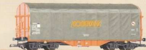
37709 Schiebeplanenwagen Shimmns-tu 718 „Sogetank“ DB AG Ep. VI 100 486 VI DB AG 84,99 €* Sliding Tarp Car Shimmns-tu 718 "Sogetank" DB AG VI