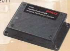
35030 89,99 €* Pendelautomatik, analog Analog Automatic Shuttle