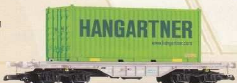
37712 Flachwagen mit 20' Container „Hangartner“ SBB Ep. VI 100 486 VI SBB 99,99 €* Flat Car with 20' Container Hangartner SBB VI