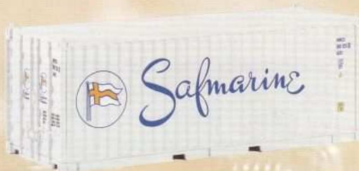
36301 Container 20' „Safmarine“ Ep. V 100 486 V DB AG 27,99 €* Container 20' "Safmarine" V