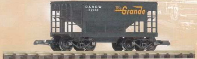
38813 Schüttgutwagen D&RGW 42,99 €* D&RGW Ore Car Vorserienmuster / pre-production sample