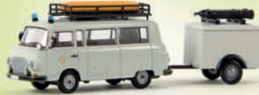
v 30024 Barkas B 1000 Bus mit Anhänger „Wasserrettungsdienst“, TD 19,90 €