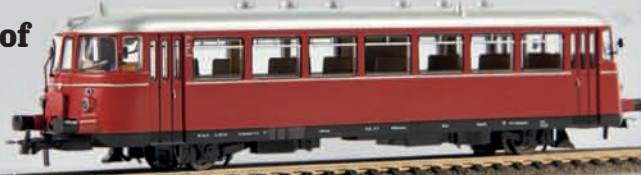
v 64010 MAN Schienenbus VT 26 neutral (DC), TD 109,00 €