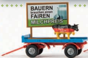
55236 2-Achs-Leichtanhänger mit Werbetafel und Kuh „Die faire Milch“ 12,90 €