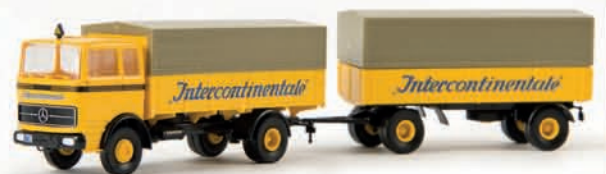
81030 MB LP 1418 „Intercontinentale“ 21,90 €