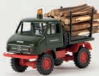
v 39022 Unimog 411 mit Holzladung 14,90 €