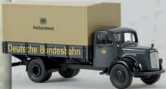
v 40016 MB L 311 „Rollfuhrdienst“ 10,90 €