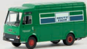
v 34520 Fiat Zeta „Deutz Fahr“ 14,90 €