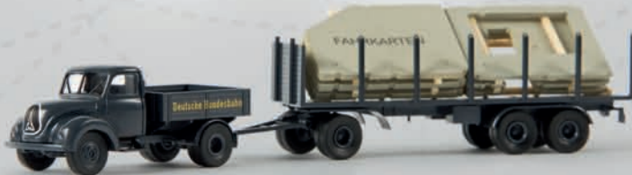
v 42231 Magirus Mercur mit „Behelfs-Fahrkartenschalter“ 24,90 €