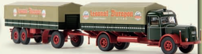
v 86109 Kaelble K 832 L „Lesonal“, TD 32,90 €