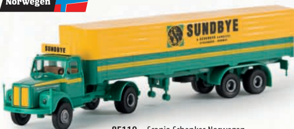
85119 Scania Schenker Norwegen „Sundbye“ 16,90 €