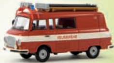
30206 Barkas B 1000 Halbbus „Feuerwehr“, TD 13,90 €