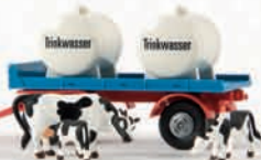
55237 2-Achs-Leichtanhänger mit Tanks und 3 Kühen 11,90 €