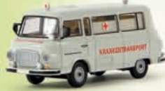
v 30027 Barkas B 1000 Bus „DRK Krankentransport“, TD 13,90 €