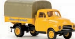
35313 Opel Blitz „Intercontinentale“ 10,90 €