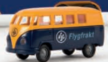
v 31017 VW Kombi T1a „ASG Flygfrakt“ 9,90 €