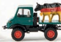
39082 Unimog 421 mit Kuh „Die faire Milch“ 15,90 €