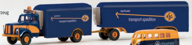
v 85008 Scania L 110 „ASG“ 21,90 €