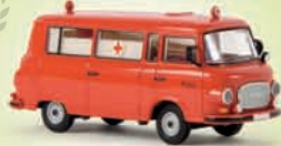
v 30026 Barkas B 1000 Bus „Feuerwehr Krankenwagen“, TD 13,90 €