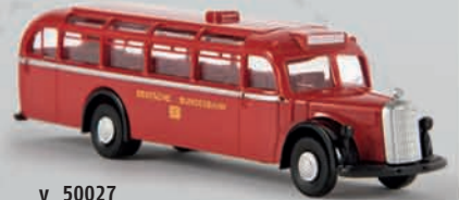
v 50027 MB O 6600 Reisebus „DB“ 18,90 €