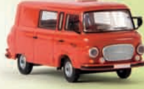
v 30215 Barkas B 1000 Halbbus rot, TD 11,90 €