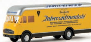
57214 MB LP 322 Möbelwagen „Intercontinentale“ 16,90 €