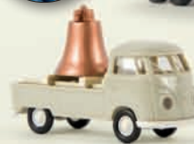
v 32944 VW Pritsche T1b „Glockentransport“, mit Ladegut 12,90 €