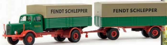
44306 MB L 325 „Fendt“ 17,90 €