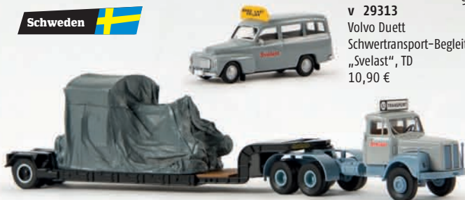
v 85120 Scania Schwertransporter „Svelast“, mit Ladegut 34,90 €