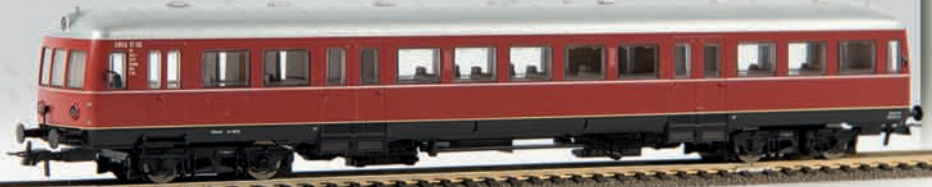
64100 Esslinger Triebwagen, VT 102 „SWEG“ (DC), TD 139,00 €

Demnächst in der Auslieferung: Der von 1951 - 1955 gebaute vierachsige Privatbahn-Triebwagen in der Version der SWEG (Südwestdeutsche Eisenbahn-Gesellschaft mbH). Beide Ausführungen (mit - und ohne Werbung) sind in Kürze lieferbar.