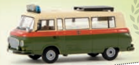
v 30025 Barkas B 1000 Bus „Volkspolizei Verkehrskontrolle“, TD 13,90 €